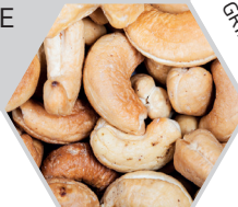
NOIX DE CAJOU GRILLÉES