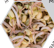
GRAINES DE SOJA GERMEES