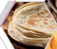
TORTILLA DE MAÏS