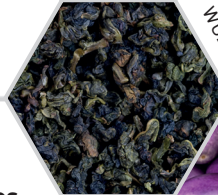
THÉ WU LONG